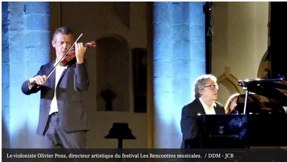
Le violoniste Olivier Pons, directeur artistique du festival Les Rencontres musicales.