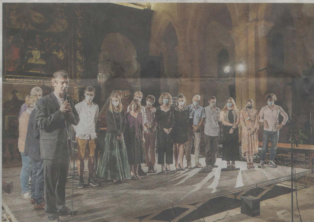
Les bénévoles du festival sur scène.

Nous sommes satisfaits de la fréquentation, les jauges étaient remplies presque tous les soirs. La programmation était très variée, avec des effectifs allant de 70 personnes sur scène en comptant l'orchestre et le chœur, à des soirées avec un seul soliste, et des