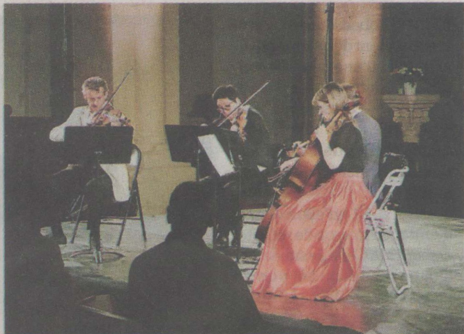
Lors des concerts et spectacles le masque est obligatoire mais peut s'enlever une fois assis.