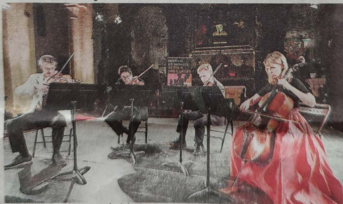
Lors d'une édition précédente.

Tarif : 20 €, réduit 15 €. Pass sanitaire demandé.