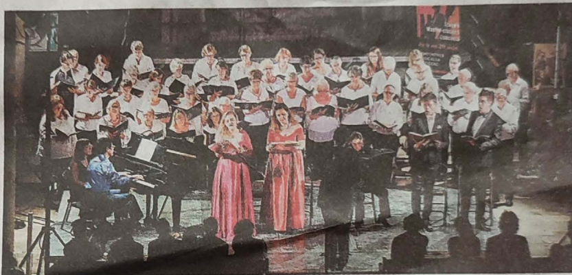
Le Chœur et l'Orchestre du festival à nouveau réunis.