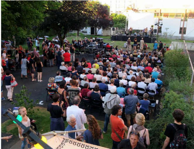
L'été sera animé sur le Grand Figeac.

La programmation artistique et culturelle hors les murs largue les amarres à partir du mardi 6 juillet 2021. L'été culturel sera animé sur le Grand Figeac !