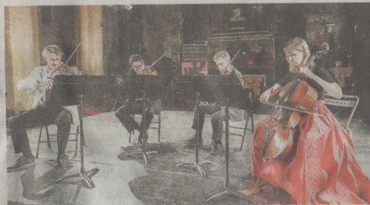
À découvrir ce soir à Bagnac-sur-Célé.